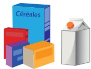
EMBALLAGES EN PAPIER-CARTON ET BRIQUES ALIMENTAIRES