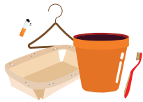
PLASTIQUES DURS & NON RECYCLABLES / MÉGOTS