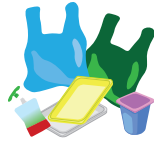
SACS PLASTIQUES, SUREMBALLAGES, POTS (YAOURT, CRÈME...), BARQUETTES EN POLYSTYRÈNE...