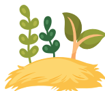
JE BROIE ET JE PAILLE POUR PROTÉGER MES PLANTES ET MES SOLS