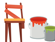
DÉCHETS MÉNAGERS SPÉCIAUX